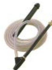
Chorro de arena